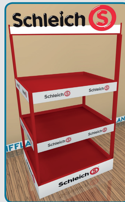
3D Rendering zur Visualisierung

Konstruktion eines Metallmöbels als halbe Europalette mit unterschiedlichen Ebenen, das die Produkte optimal präsentiert und gleichzeitig für den Handel leicht zu transportieren ist. Hohe Awareness durch Logofarben und leicht zu wechselnden Topper.